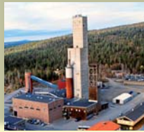
Laisvallgruvan. Idag är gruvan fylld med vatten.

I Laisdalen finns guidade turer. Utgångspunkt är Fjällcampen i Laisvall som håller öppet varje dag 10.00–18.00. Välkommen!